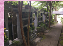
いつでもお参りいただけます