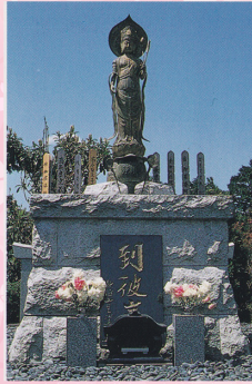
聖観音像が皆様をお守りします

通常の寺院となら変わることなく檀家の関係が保てますので、法事、慶事のことやご相談など、どうぞお気軽にお尋ねください。