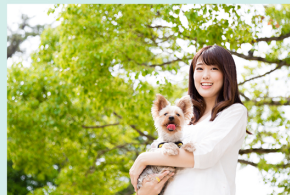
大切なペットと永遠にご一緒です